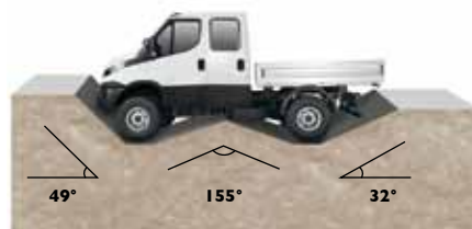
Передний угол проходимости (градусы)