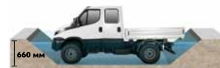
Глубина преодолеваемого брода